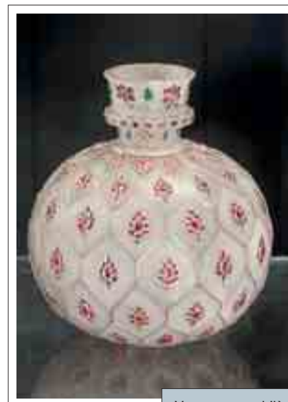
Vaso per narghile